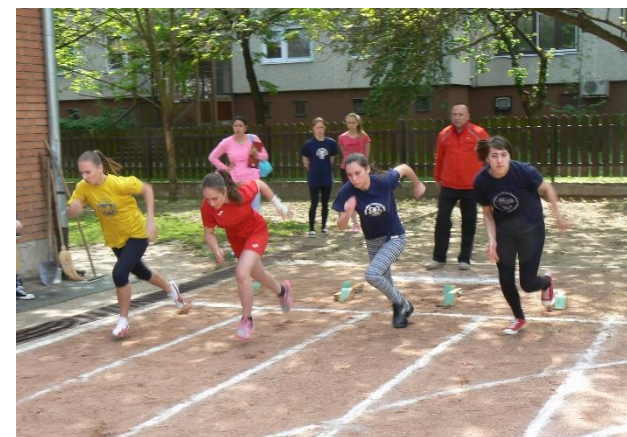
Pincér gyakorlat a tanteremben